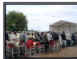
Messe en pleine air