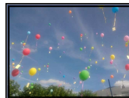
Lâché de ballon

Dimanche 21 août, le Comité Régional de Tourisme Équestre de Champagne Ardenne a organisé cette année sur le port leur randonnée annuelle.