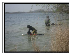
Chiens de sauvetage